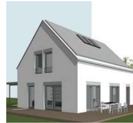
ARCHITEKTENHAUS LIGNEA ED134