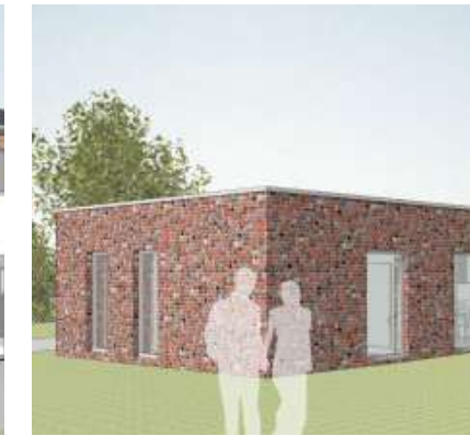
ARCHITEKTENHAUS LIGNEA BL121