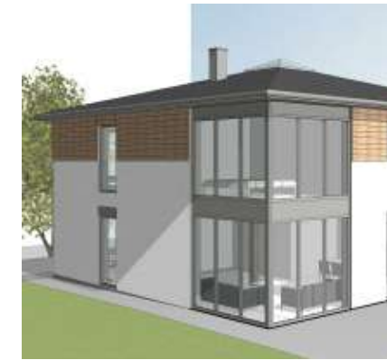
ARCHITEKTENHAUS LIGNEA SV197